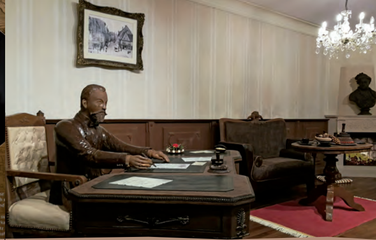
Ein Traum aus 1,5 Tonnen Schokolade - das Halloren Schokoladenzimmer.