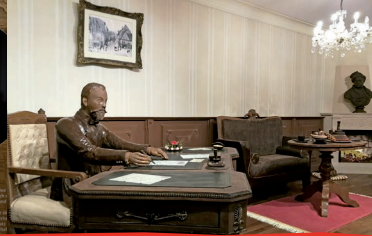
Ein Traum aus 1,5 Tonnen Schokolade - das Hallore n Schokoladenzimmer.